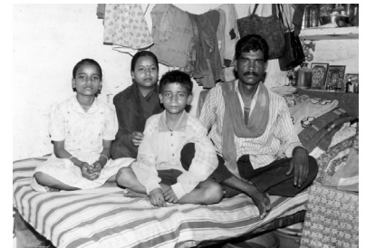
Cette famille sauvée de la misère grâce à la help-line.

A.C : -On a trouvé ça génial, baser vos pré-écoles sur la confiance en soi, ce n'est plus accumuler uniquement des connaissances, c'est appliquer dans le réel ce principe de triangulation dont vous avez fait votre devise.