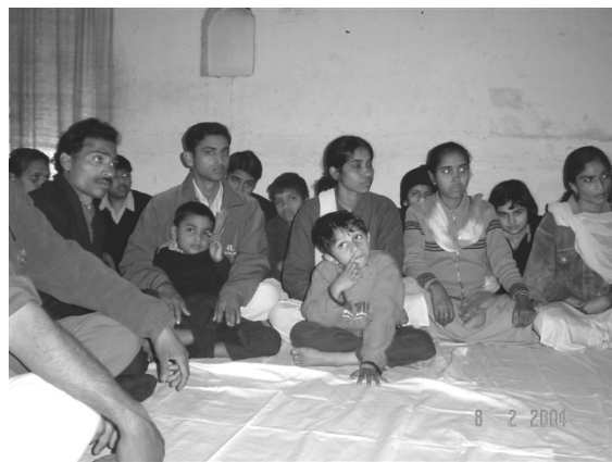
Les enfants du centre de restructuration et d'éveil des enfants handicapés mentaux avec ceux qui les accompagnent.

imaginer avant de vous rencontrer. Ceci a été rendu possible grâce au Dr TULSI qui a eu le courage de prendre position dans le monde