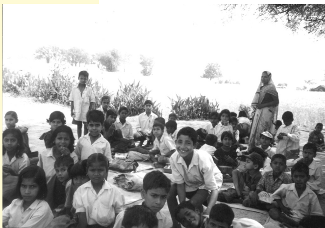
le sourire des écoliers d'Ambedkar

Cette école n'est pas fondée que sur les savoirs et ne vise pas uniquement à insérer ces enfants socialement et